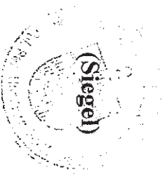
..... (Rupert Fleischhacker)