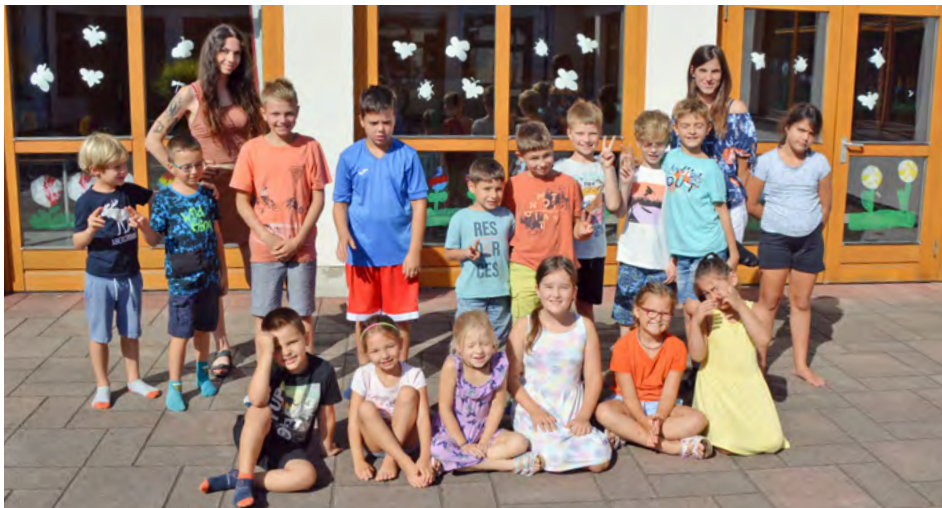
Kinder wurden während der Ferien in der Sommerspielgruppe betreut.