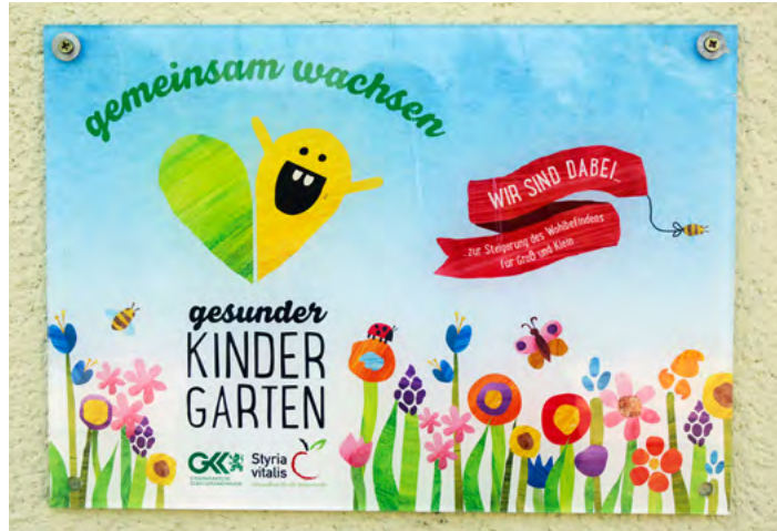
Aus dem Pfarrkindergarten Ilz wird der Gemeindekindergarten.

„Seitens der Marktgemeinde tragen wir Sorge für eine zeitgemäße, arbeits- und familienfreundliche Kinderbetreuung sowie bestens geschultes Personal im elementarpädagogischen Bereich, um die Kinder in ihrer individuellen Entwicklung bestmöglich fördern zu können“, so Bürgermeister Rupert Fleischhacker.