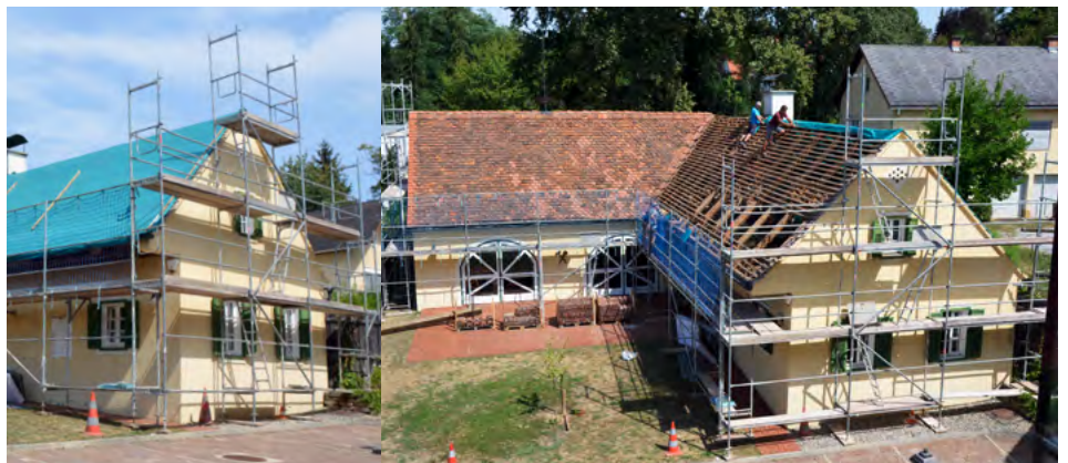
Seit Ende August wird am Dach des Heimatmuseums gearbeitet.