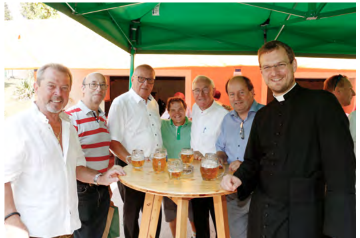
Feier des Pfarrfests am 24. Juli im schattenspendenden Pfarrgarten.