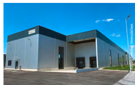
Längsseite der im März 2022 eröffneten Hallen.

Inzwischen expandiert das erfolgreiche Unternehmen auch am Standort Ilz. In einem überaus straffen Bauzeitplan von August dieses Jahres bis März 2023 werden im Industriegebiet Neudorf auf einer Nutzfläche von 11.900 Quadratmetern vier weitere Hallenabschnitte samt dazugehörigen Büro- und Sozialflächen für ein heimisches Industrieunternehmen errichtet.