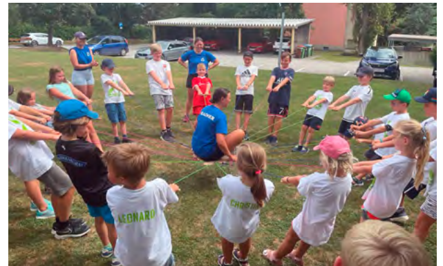
Bewegungsfreude und Geschicklichkeit wurden gefördert.

stenfeld. „Die Sportwoche sollte zum einen ein Beitrag für mehr Fitness und Gesundheit unserer Kinder sein und zum anderen durch die ganztägige Betreuung eine Unterstützung für die Eltern während der Ferien darstellen“, zeigte sich Bürgermeister Rupert Fleischhacker über die Begeisterung des Ilzer Nachwuchses erfreut.