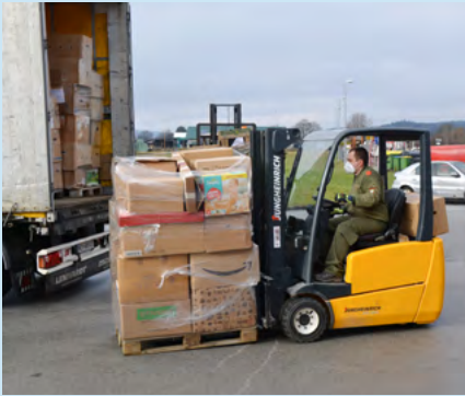
50 Paletten an Hilfsgütern wurden in Ilz verladen.

Bekleidung zusammen. Die Kapazitäten des Rüsthauses waren am ersten Spendentag ausgeschöpft. Neben zahlreichen Ilzer Firmen, die Waren spendeten, stellten Reifen Rechberger und das Temmel Logistikzentrum LKWs für den Transport in die Erdbebenregion bereit. Lutterschmied