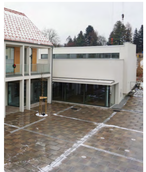
Die größte Investition macht auch 2021 das Zentrum aus.