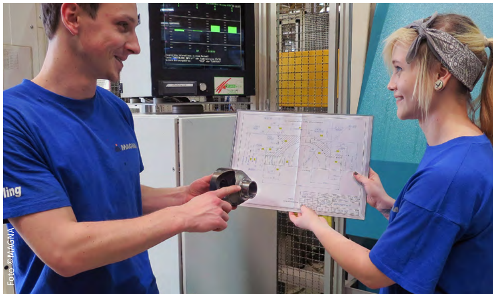
MAGNA bietet eine hochprofessionelle Lehrlingsausbildung und Top-Karrierechancen.