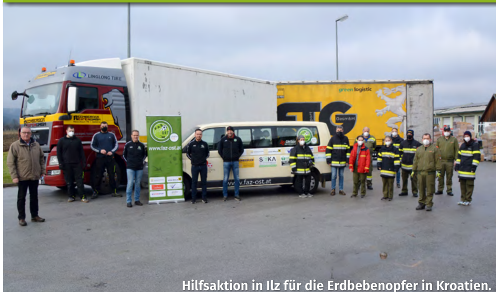
Hilfsaktion in Ilz für die Erdbebenopfer in Kroatien.